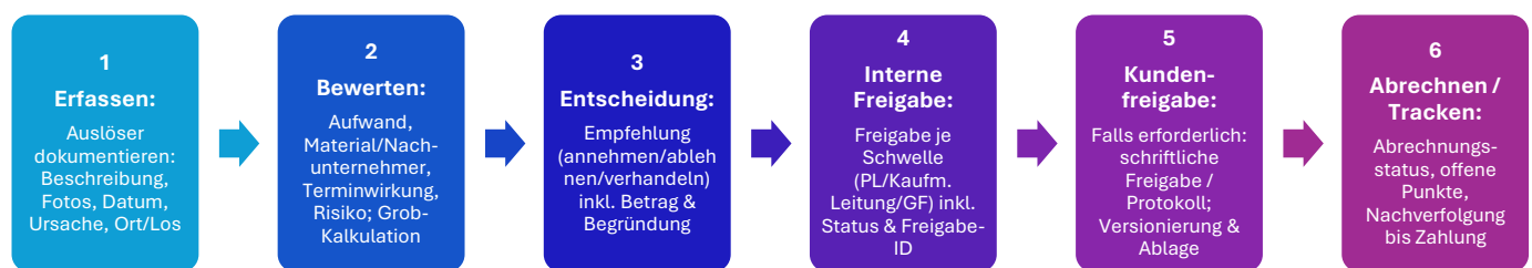
Abbildung: Standardworkflow Nachtragsfreigabe (6 Schritte)